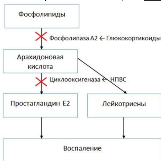
Рис 4. Механизм действия стероидных и нестероидных противовоспалительных средств

К стероидным противовоспалительным средствам относят глюкокортикоиды (преднизолон, дексаметазон и др.). Они обладают мощнейшей противовоспалительной активностью, влияя на все фазы воспаления: альтерацию, экссудацию и пролиферацию. Механизм их действия связан с блокадой фосфолипазы и прекращением образования арахидоновой кислоты, что ведет к уменьшению образования провоспалительных медиаторов - не только ПГ, но и лейкотриенов (рис. 4).