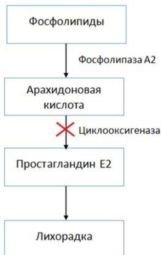
Рис 3. Механизм действия жаропонижающих средств

активность фермента циклооксигеназы (ЦОГ) и снижать синтез воспалительных простагландинов. ПГ группы E, увеличивая концентрацию циклического аденозинмонофосфата (цАМФ) в гипоталамусе, способствует повышенному поступлению кальция в клетки и их активации (рис. 3).