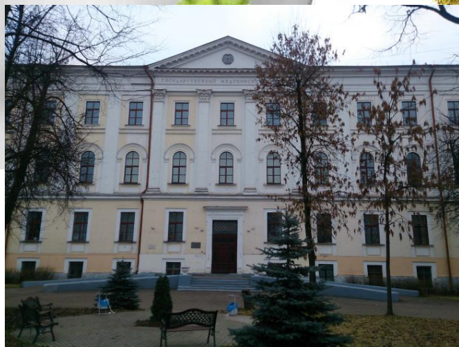
Научный отдел ФГБОУ ВО Тверской ГМУ Минздрава России 07.04.2021 г.