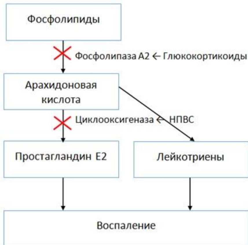
Рис 4. Механизм действия стероидных и нестероидных противовоспалительных средств

К стероидным противовоспалительным средствам относят глюкокортикоиды (преднизолон, дексаметазон и др.). Они обладают мощнейшей противовоспалительной активностью, влияя на все фазы воспаления: альтерацию, экссудацию и пролиферацию. Механизм их действия связан с блокадой фосфолипазы и прекращением образования арахидоновой кислоты, что ведет к уменьшению образования провоспалительных медиаторов - не только ПГ, но и лейкотриенов (рис. 4) .