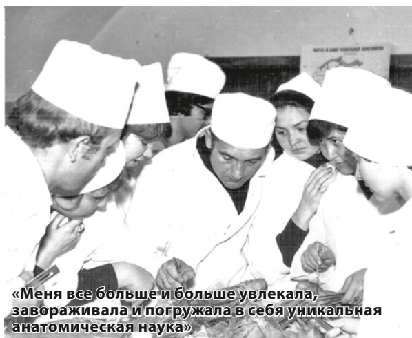
«Меня все больше и больше увлекала, завораживала и погружала в себя уникальная анатомическая наука»